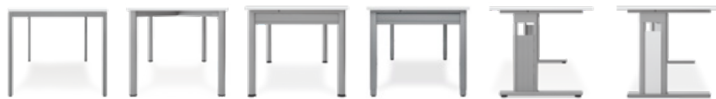
4 Fuß Eco