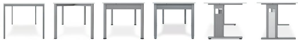
4 Fuß Eco