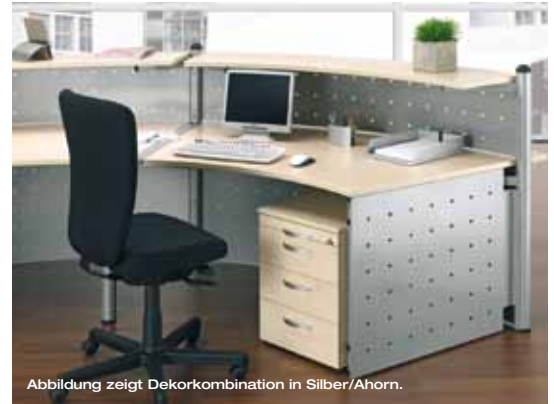
Abbildung zeigt Dekorkombination in Silber/Ahorn.

Es gibt keine zweite Chance für den positiven ersten Eindruck – auf diesem Grundsatz basieren Design und Konzept von Geramöbel. Hinter dem repräsentativen Thekenelement verbirgt sich ein vollwertiger Arbeitsplatz – und der hinterlässt einen bleibenden Eindruck auch nach dem zweiten Hinsehen.