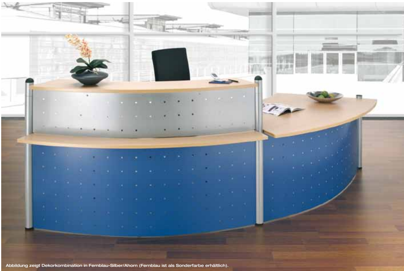
Abbildung zeigt Dekorkombination in Fernblau-Silber/Ahorn (Fernblau ist als Sonderfarbe erhältlich).