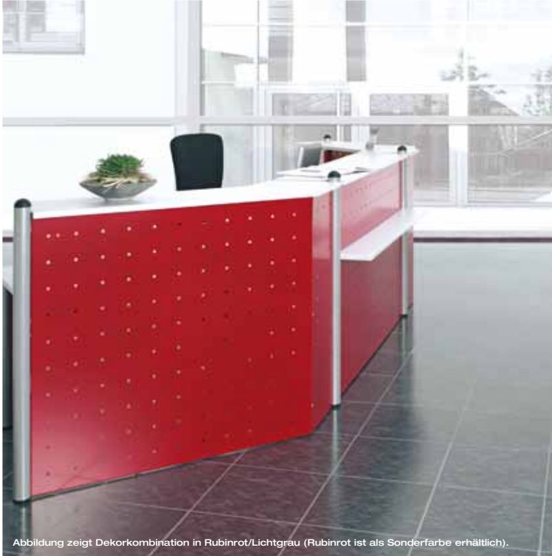
Abbildung zeigt Dekorkombination in Rubinrot/Lichtgrau (Rubinrot ist als Sonderfarbe erhältlich).

Es gibt keine zweite Chance für den positiven ersten Eindruck – auf diesem Grundsatz basieren Design und Konzept von Geramöbel. Hinter dem repräsentativen Thekenelement verbirgt sich ein vollwertiger Arbeitsplatz – und der hinterlässt einen bleibenden Eindruck auch nach dem zweiten Hinsehen.